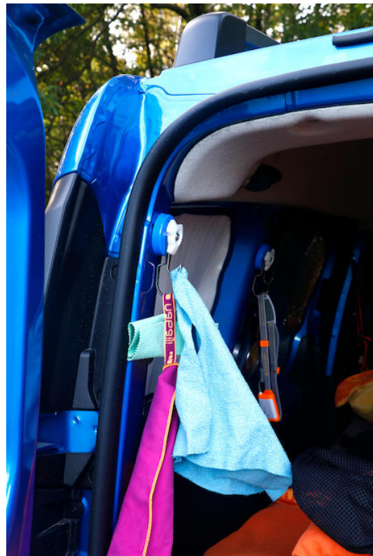
Un gancio magnetico diventa un portasciugamani

In un camper i ganci magnetici doppi ( www.supermagnete.ch/ita/M-90 ) sono davvero pratici come portasciugamani. Permettono di creare in un batter d'occhio un posto fisso per gli asciugamani, senza dover forare l'amato furgoncino o i mobili. Proprio in uno spazio così piccolo è fantastico che certe cose, come gli asciugamani, abbiamo il loro posto fisso. Da un lato, tutto resta più ordinato e, dall'altro, gli asciugamani sono sempre a portata di mano quando sono necessari. Un altro vantaggio è che gli asciugamani si asciugano meglio se sono attaccati ai ganci.