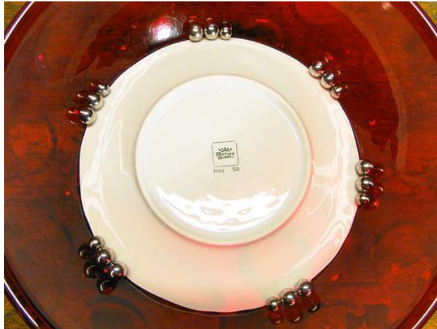
Der Kugelmagnet befindet sich immer rechts von den beiden Stahlkugeln